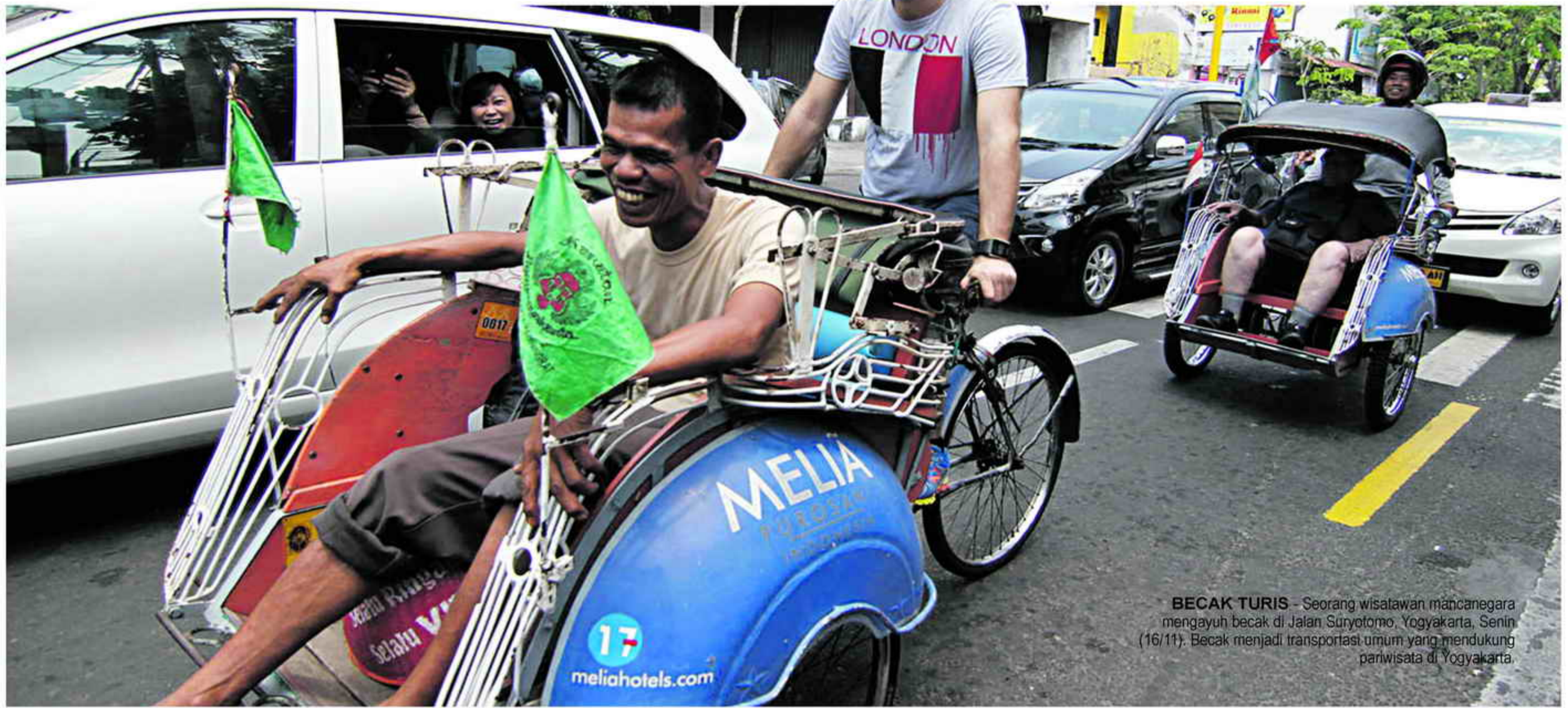
BECAK TURIS - Seorang wisatawan mancanegara mengayuh becak di Jalan Suryotomo, Yogyakarta, Senin (16/11). Becak menjadi transportasi umum yang mendukung pariwisata di Yogyakarta.